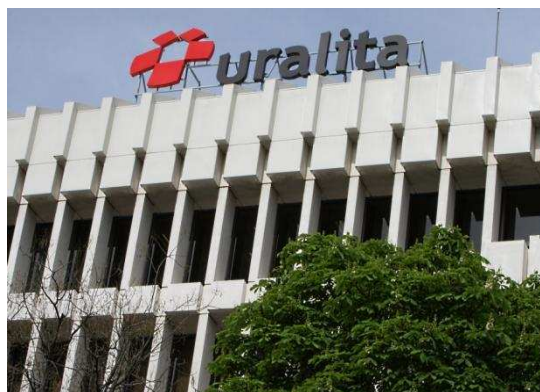
Seu de Uralita a Madrid

El Gabinet d'advocats Roca Junyent, ens ha comunicat que, a instàncies del jutjat de 1 a . instància núm 46 de Madrid i per ordre del jutge d'instrucció del cas, l'empresa Uralita, SA. Finalment i just en el límit imposat per aquest Jutjat abans de procedir a l'embargament de béns; ; ha dipositat en un compte judicial, l'import total, corresponent a les indemnitzacions a què va ser